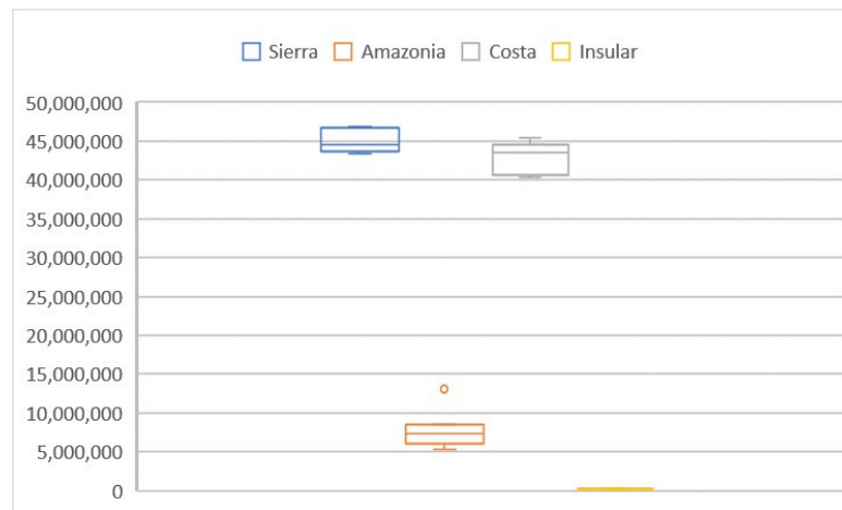
Figura 2. Gráfico Box Plot PIB por región del Ecuador 2014-2020